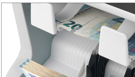
Identifica billetes no aptos para cajeros automáticos y su recirculación