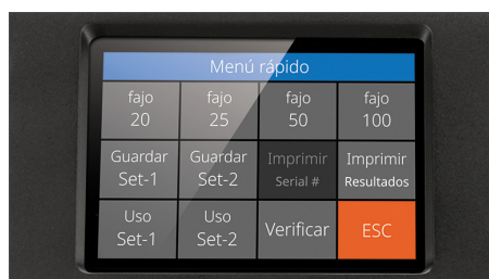
Pantalla táctil de alta definición con interfaz multilingüe y menú de acceso rápido