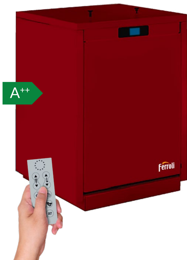
Mando a distancia incluido

Termoestufa de pellets de alta eficiencia energética con rendimiento del 95,28%.