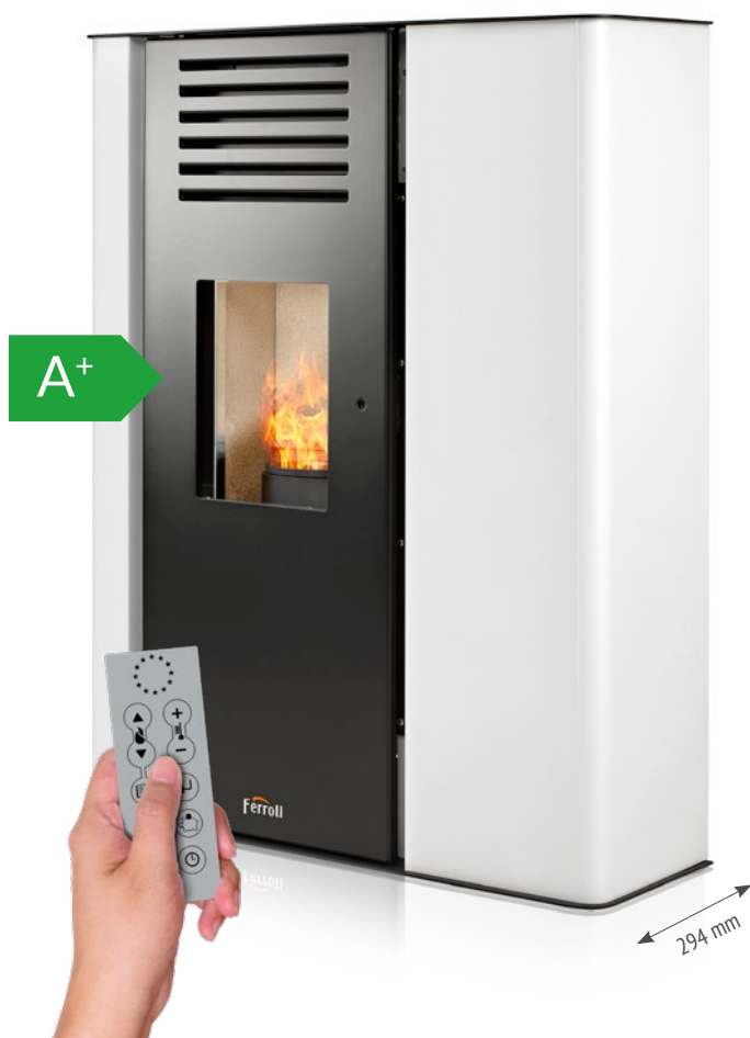
Mando a distancia incluido

Estufa de pellets modulante en acero de fondo reducido de 9 kW