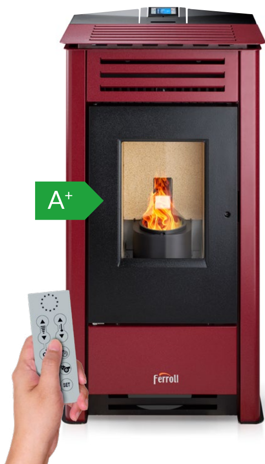
Mando a distancia incluido

Estufa de pellets modulante en acero de 10,41 kW