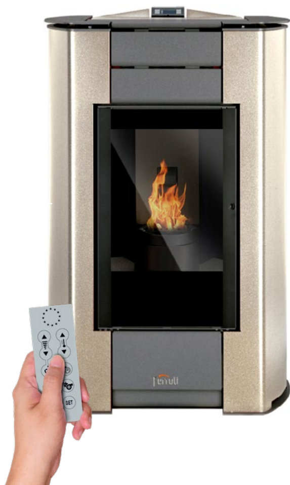
Mando a distancia incluido

Estufa de pellets modulante en acero de 14,1 kW