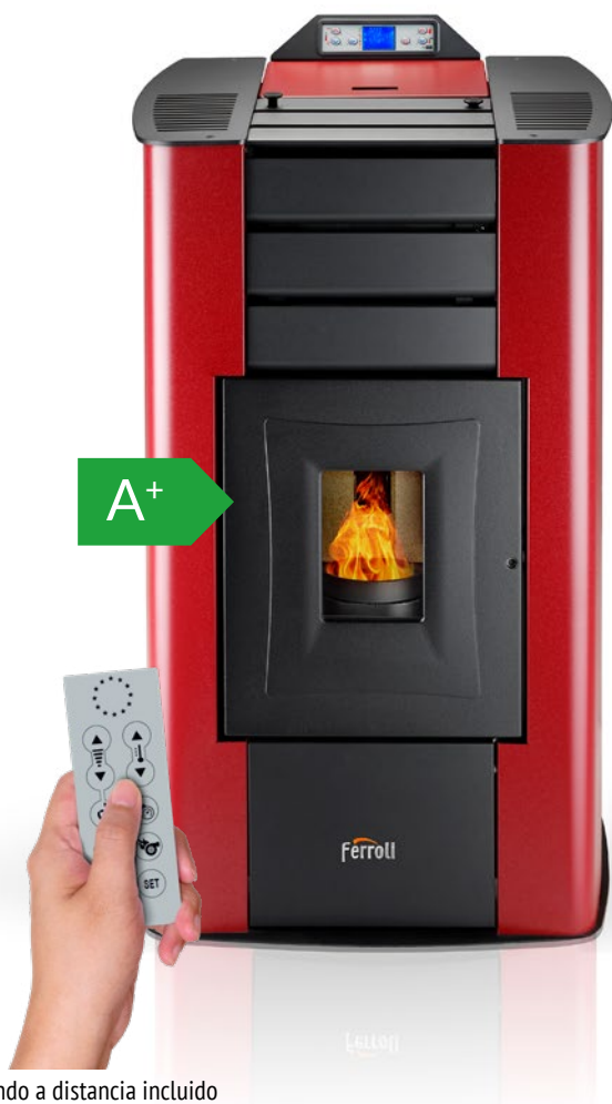
Mando a distancia incluido

Termoestufa de pellets modulante en acero de 18,5 kW